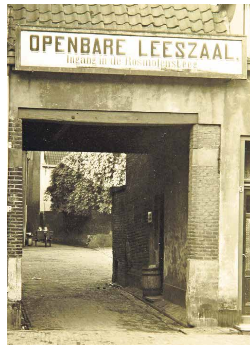
Ingang naar de openbare leeszaal in de Rosmolensteeg rond 1908.

Toegang is gratis, wel graag aanmelding via mail aan info@graafschapbibliotheken.nl